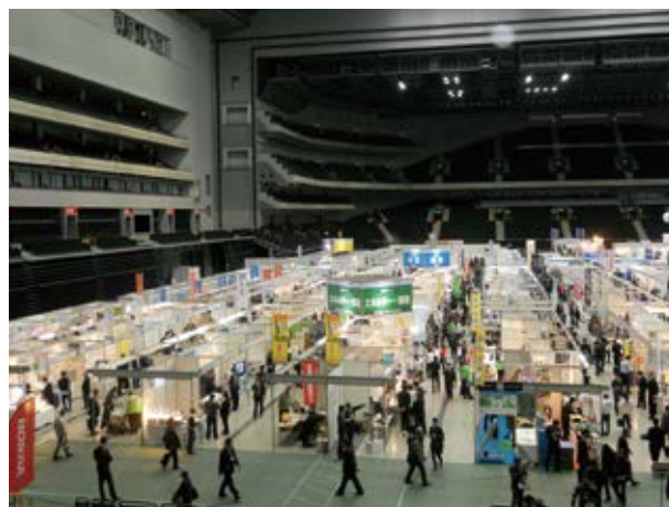
彩の国ビジネスアリーナ会場風景

また、日本電気(株)が当財団と取り組む環境省委託事業を、(株)早稲田環境研究所が小型ULV(実物)を紹介しました。約16,500人が来場し、当財団をアピールすることができました。