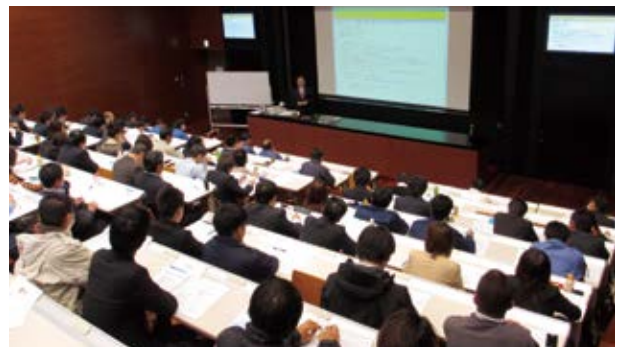
クレーム対応研修の様子

7月24日(火)に開催したビジネス文書研修から始まって、9月11日(火)にはメンタルヘルス研修、12月4日(火)と11日(火)には品質管理研修、2月12日(火)にはクレーム対応研修と、4講座の研修会を開催しました。どの研修会にも多くの方々が参加され、専門的かつ実践的な内容を学習しました。