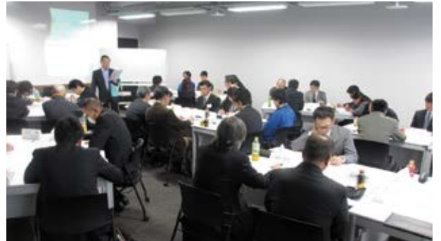
幹部候補育成研修の様子

11月6日(火)と13日(火)の二日間にわたって開催した「幹部候補育成研修」では、中堅社員や幹部候補の方など38名が参加。グループ討議などを通してリーダーシップやチャレンジ精神の向上、経営指標の基礎知識と後輩育成指導などを熱心に学びました。